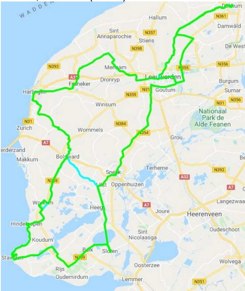
Elfstedentocht (210 km)