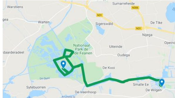
Drachten- Alde Feanen (25 km)